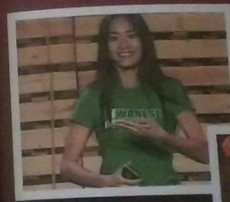
謝怡芬 Janet 《讓世界成為你的遊樂場》